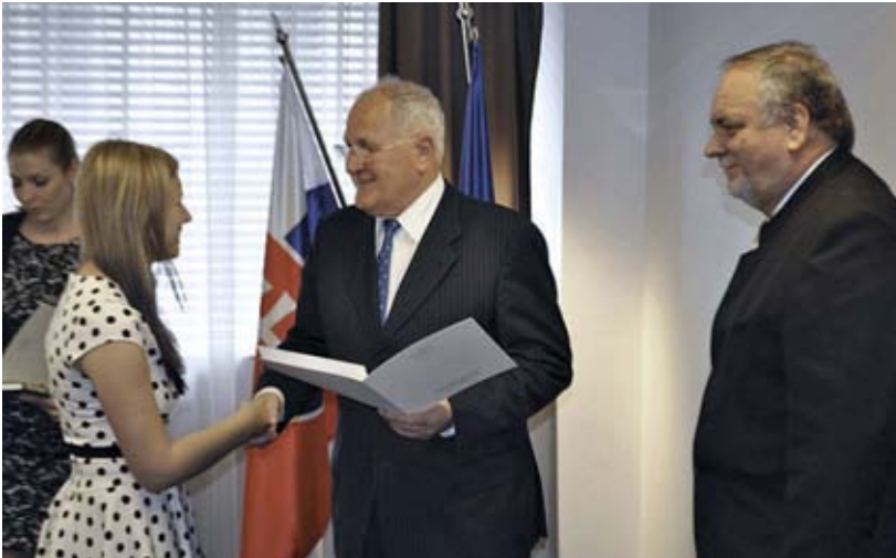
Vítazov 11. ročníka projektu ocenil v júni na slávnostnom odovzdávaní cien vtedajší minister školstva Dušan Čaplovič.

ním svojej histórie. Ukazuje sa, že úlohou školy je stále viac poskytovať žiakovi nielen vedomosti, ale aj kompetencie a najmä posilňovať jeho hodnotový svet vrátane toho, aby sa dokázal zorientovať v otázke vlastnej identity a hodnoty svojho členstva. Projekt Poznaj svoju minulosť už jedenásty rok pomáha žiakom základných a stredných škôl práve v týchto témach. Odborníci okrem iného konštatujú, že v slovenských rodinách dochádza v posledných rokoch ku generačnej kríze. Zhoršujú sa vzťahy a komunikácia medzi rodičmi a deťmi, starými rodičmi a vnúčatami, starými rodičmi a rodičmi. Stráca sa súdržnosť rodiny, chýbajú spoločné témy, pestovanie spoločných hodnôt. Deti, ale ani mnohí dospelí nemajú ukot-