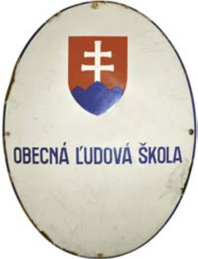
Verejná tabuľa na označenie školy z roku 1944.

Stranu pripravil Ľubomír PAJTINKA