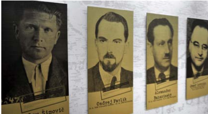
Osobnosti školstva v Povstaní.

Postupom frontovej línie na Slovensku v rokoch 1944 a 1945 sa už na mnohých miestach v školách začalo vyučovanie. Druhá svetová vojna spôsobila v školstve