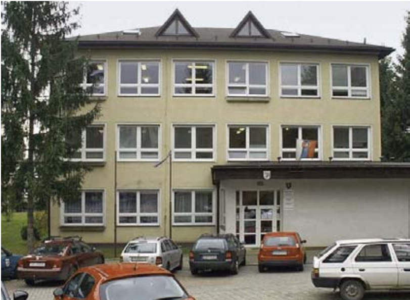
Budova SOŠ podnikania v B. Bystrici.

Technologický pokrok, nárast informácií a inovácie sa výrazne prejavujú aj vo vzdelávaní. Byť úspešný v informačnej spoločnosti si vyžaduje flexibilitu. Školy sa musia prispôbiť novým trendom a vychovávať absolventov schopných uplatniť sa na dynamickom trhu práce. Preto školstvo reaguje inovatívnymi zmenami vzdelávacích systémov založenými na nových metódach a spôsoboch vyučovania mladých ľudí. Stredná odborná škola (SOŠ) podnikania v Banskej Bystrici zabezpečuje prípravu žiakov v profesiách, ktoré pokrývajú