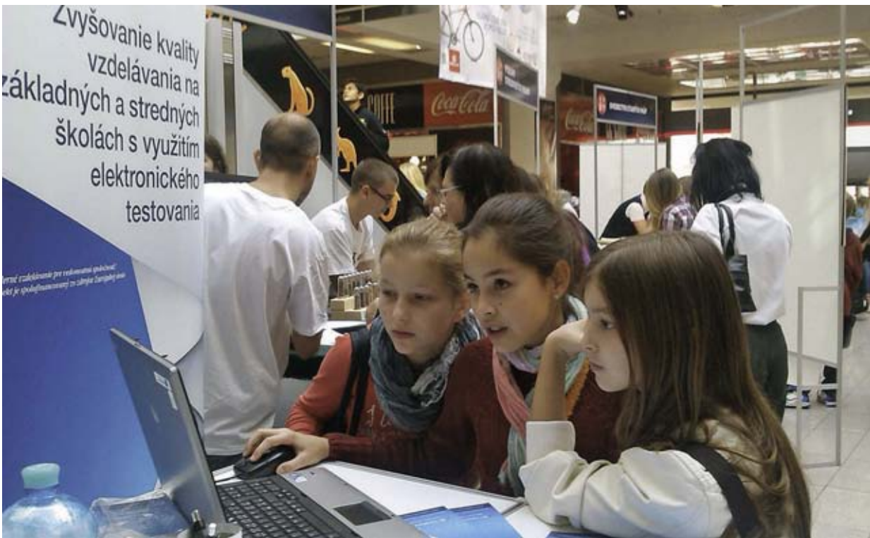
Zo stánku NÚCEM na minuloročnej Európskej noci výskumníkov.

Do 10. septembra mali základné a stredné školy povinnosť vydať svojim žiakom vzdelávacie poukazy na mimoškolskú činnosť. Následne si žiak spolu s rodičmi vyberie do 25. septembra konkrétne záujmové vzdelávanie a poukaz odovzdá škole alebo školskému zariadeniu, ktoré vzdelávanie poskytuje. V školskom roku 2014/2015 má vzdelávaci poukaz hodnotu 29,3 eura, čiže 2,93 eura na mesiac. Škola nemôže brániť svojim žiakom, aby poukaz použili v inej škole alebo školskom zariadení. Žiak nie je povinný poukaz odovzdať žiadnemu poskytovateľovi záujmového vzdelávania. V takomto prípade sa nevyčerpané finančné prostriedky presúvajú na iný účel v rozpočte rezortu školstva. V školskom roku 2013/2014 bolo využitých 579 912 poukazov, za ktoré ministerstvo vyplatilo zriaďovateľom takmer 17 miliónov eur. (mš)