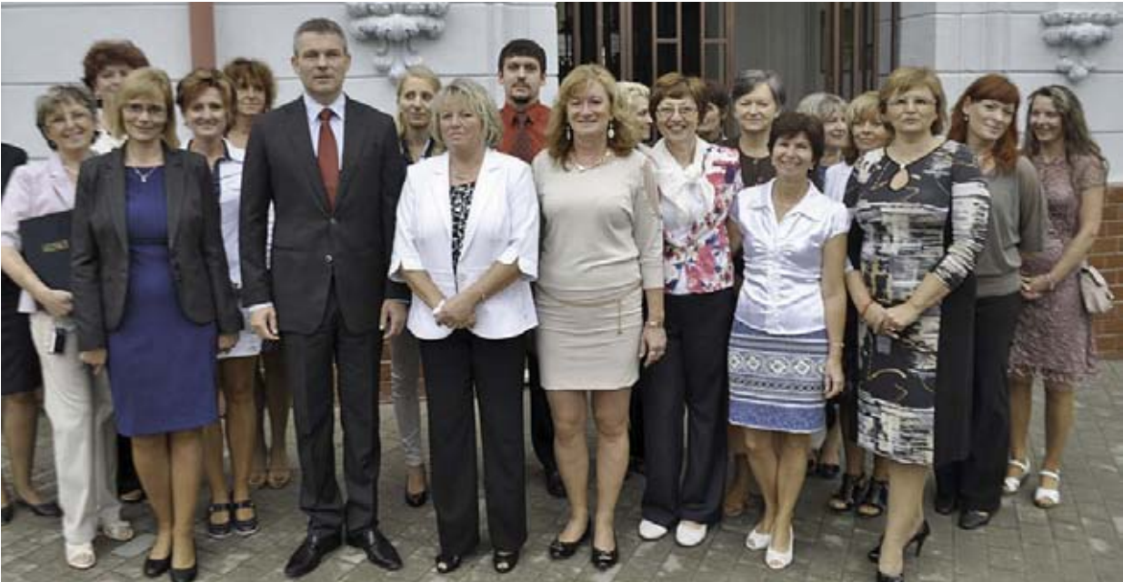
Minister školstva s kolektívom učiteľov Základnej školy Slobodného slovenského vysielateľa, ktorú ako chlapec navštevoval, na prahu nového školského roka.

Povinne učíme anglický jazyk, nemecký jazyk, francúzsky jazyk a ruský jazyk.