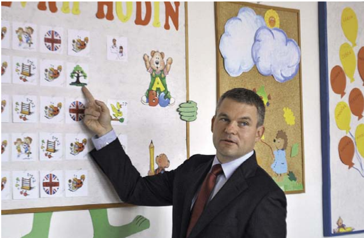
Minister Peter Pellegrini stihol prebrať s čerstvými prvákmi v Banskej Bystrici aj ich nový rozvrh hodín.