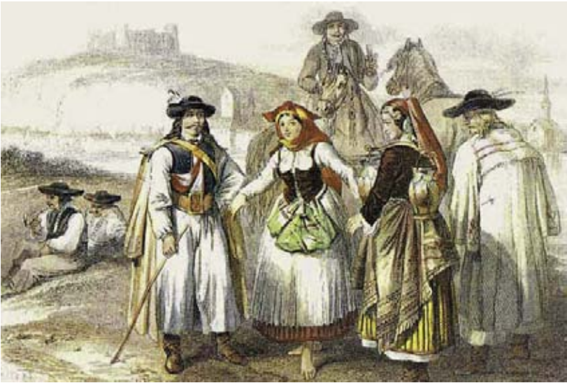
Maďari a Chorváti z okolia Bratislavy oblečení v halenách.

Majstri tohto cechu mali právo prezerať výrobky cudzích remeselníkov privázané do Bratislavy na jarmoky a od každého