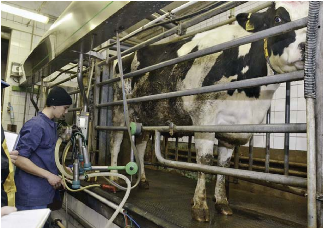
Podujatie Hovorme o jedle by malo žiakom základných škôl priblížiť aj základné poznatky o chove hospodárskych zvierat. Snímka je z tradičnej Súťaže o mlieku, každoročne organizovanej pre žiakov stredných odborných škôl.