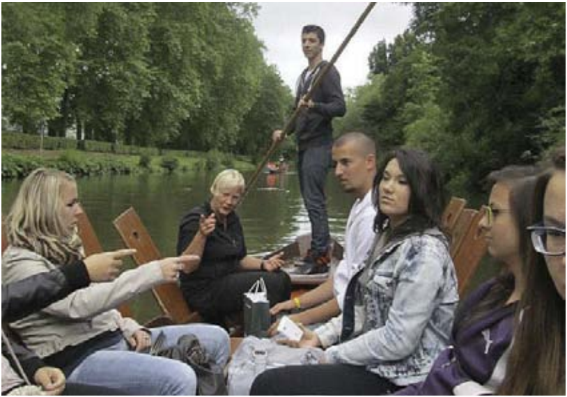
Plavba na pltiach po zákutiach rieky Neckar.