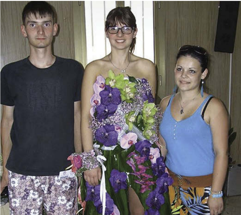
Študenti z Pruského a ich kvetinová modelka.

Zaujímavým aspektom súťaže bol fakt, že medzi sebou bojovali profesionáli spolu so študentmi. Súťaž pozostávala z troch čiastkových úloh, ktoré boli hodnotené samostatne. Prvou úlohou bol kvetinový zákusok – súťažiaci museli vyzdobiť sva-dobnú tortu, ktorú si každý tím vyžrebo-val, a následne vytvoriť kvetinový koláč. Na zhotovenie tohto diela mali tri hodi-ny. Druhá úloha bola situovaná priamo do mesta Bugnary. Každý súťažiaci tím si vyžreboval konkrétne miesto v meste a vytvoril aranžmán, rešpektujúc prísne technické zadania, náročné na vypraco-